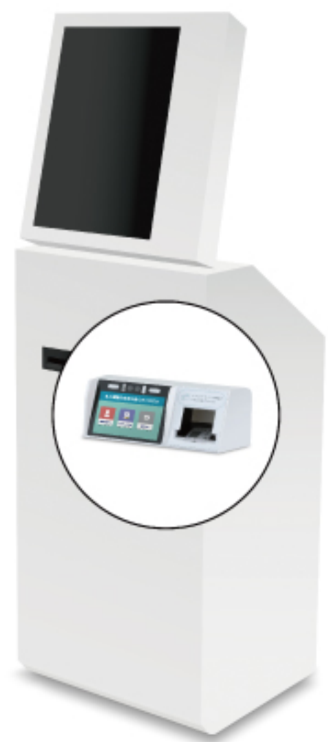
マイナタッチー体型