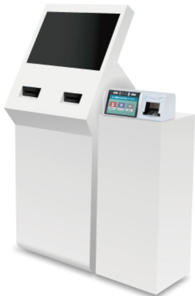
マイナタッチを既存の受付機に後付け